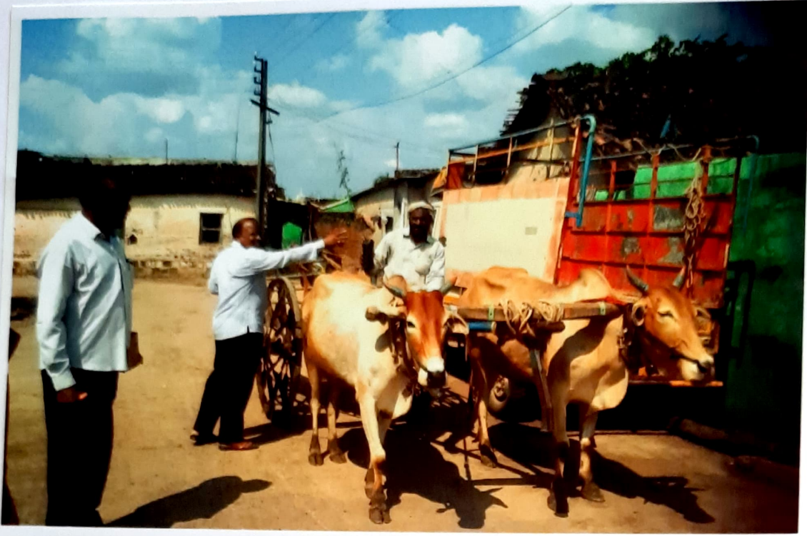
Distribution of Plants to Villagers